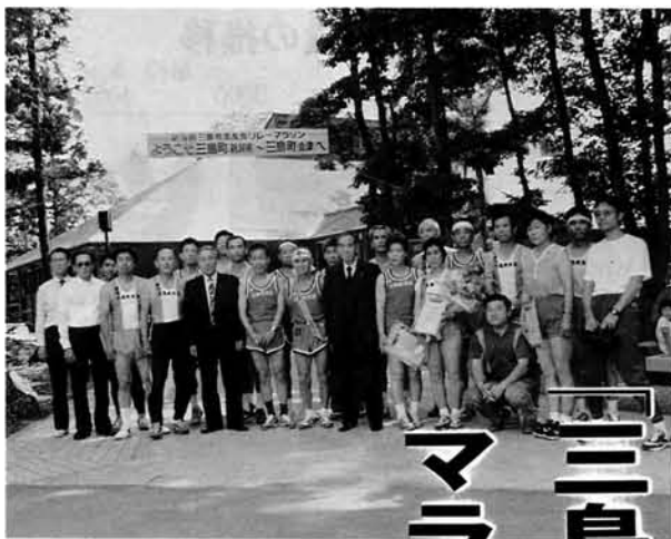
福島県三島町長を囲んで