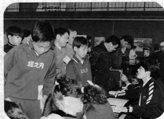
▲参加者が多くなると受付も一苦労