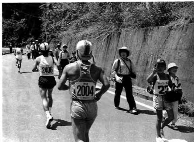
▲「ガンバレ!」「ファイト!」。偶然ハイキングに来ていた人たちから声援がとぶ