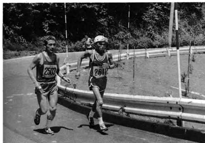
◀心臓破りの坂を力走