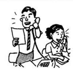
男女雇用機会均等月間