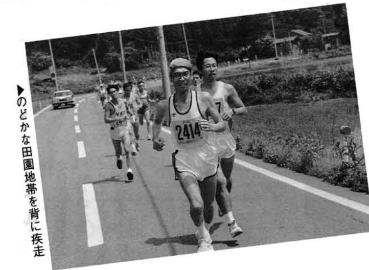
▶のどかな田園地帯を背に疾走

昭和六〇年、五十三名の参加者を集めて始まったこの大会も、今や五百余名の参加申込を受けるまでになり、まさしく「町の一大イベント」となりました。また参加者の大部分が町外の人たちであることから、「みしま」の名を知ってもらおう絶好のチャンスでもあります。 今後は、増え続ける参加者に応じた大会運営と、三島町の名を広く町外の人にPRする方策についても検討が必要となりそうです。