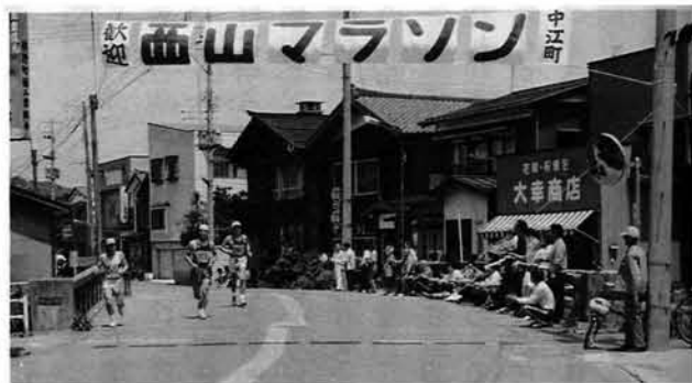
▲脇野町中江町のみなさんは横断幕を作成、応援していただきました