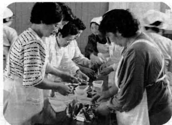
▲おにぎりの包装に忙しい日赤奉仕団のみなさん