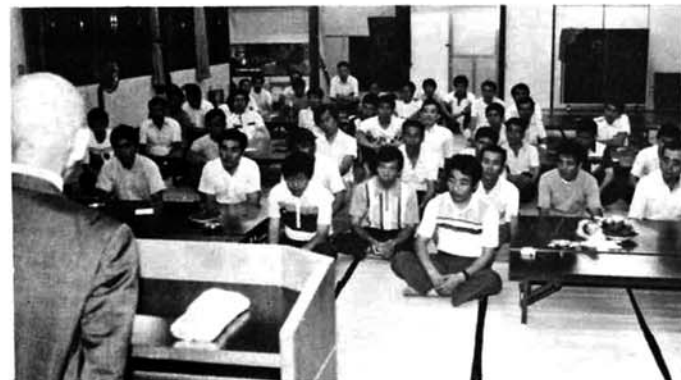
▲飯塚兄会町長と懇談会 (七月二十日夜)