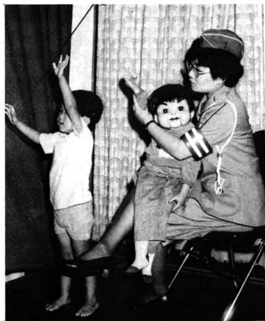
▲ 横断歩道はねえー左手じゃなくケンチャンのように右手を高く上げて渡ろうね… (岩塚保育所)