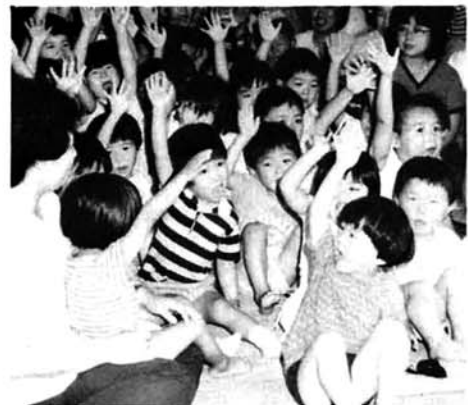
▲ とびだしはだめですよ……はい (塚山保育所)

七月十一日 岩塚・塚山の保育所で、児童と父母の交通安全教室が行われました。この安全教室は、県警のゆきつばき号にいったばいの教材を積み県内の保育所等を巡回、児童たちに事故の恐ろしさや交通のルールを指人形、映画、腹話術を通して教えています。