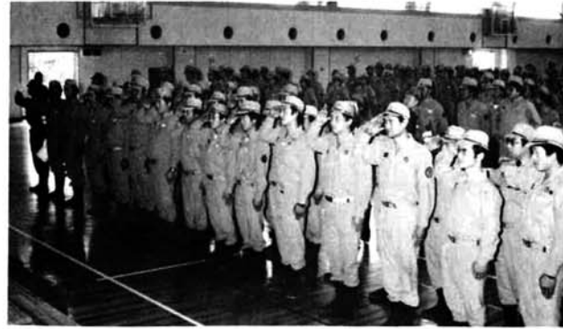
▲永年精勤章を受ける団員 (7月7日) ▼日頃の訓練ぶりを披露する団員 (今年は雨にたたられ町民体育館で 総合消防演習を実施 7月7日)