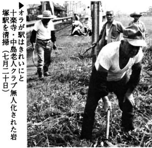
▲奥が駅はきれいに 十楽寺・中島老人クラブ無人化された岩 塚駅を清掃 (七月二十日)