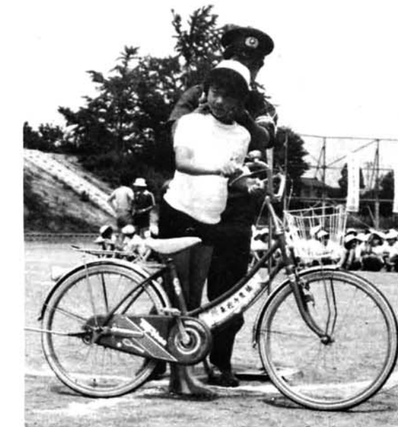
▼左右の安全確認はしっかりと……。