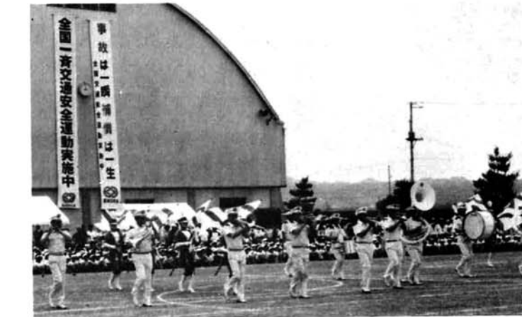
▲農協主催の来迎寺地区交通安全推進大会 (7月19日越小) 県警音楽隊とカラーガーズ