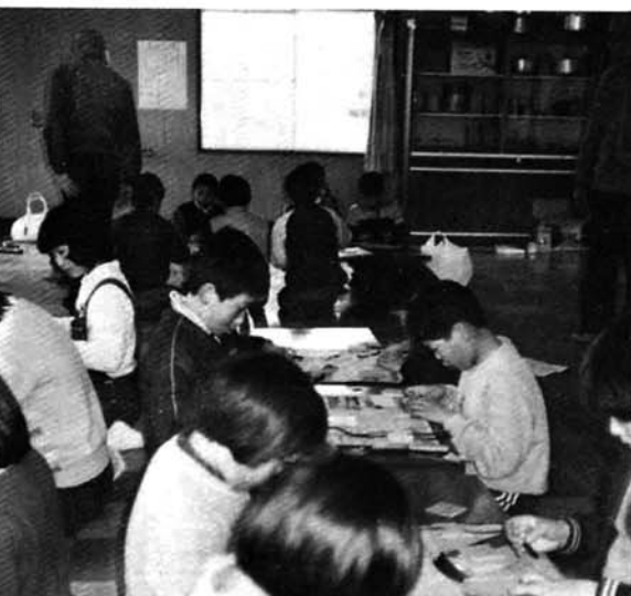
(ペタンペタン作り 釜ヶ島会場)

「むずかしい」という声があふきました。しかし、始めてから一時間くらい経って休憩をとろうとしたら、「おもしろい。休まなくていい」という子も現われました。「これなら、販売人だ。こんな冗談を云うおじいちゃんもいて、チビッ子の上達の早さには皆、ビックリしていたようです。 午後からは、新潟市のグループ「わらべ会」のおじいちゃん、おばあちゃんをお呼びして、竹トンボ・ペタンペタン・スリコギトンボ・クニヤクニヤコという伝承玩具づくりに挑戦しました。特に竹トンボとペタンペタンは好評のようでした。 小刀などあまり使ったことがな