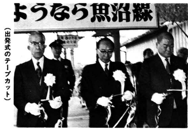
(出発式のテープカット)

愛称「軽便」魚沼鉄道は明治四十四年九月に開通、今日まで幾多の変遷をたどり地域住民の生活に欠くことのできない存在であったが、存続の希望もむなく三月三十一日、七十年余の足跡を残し廃止されました。