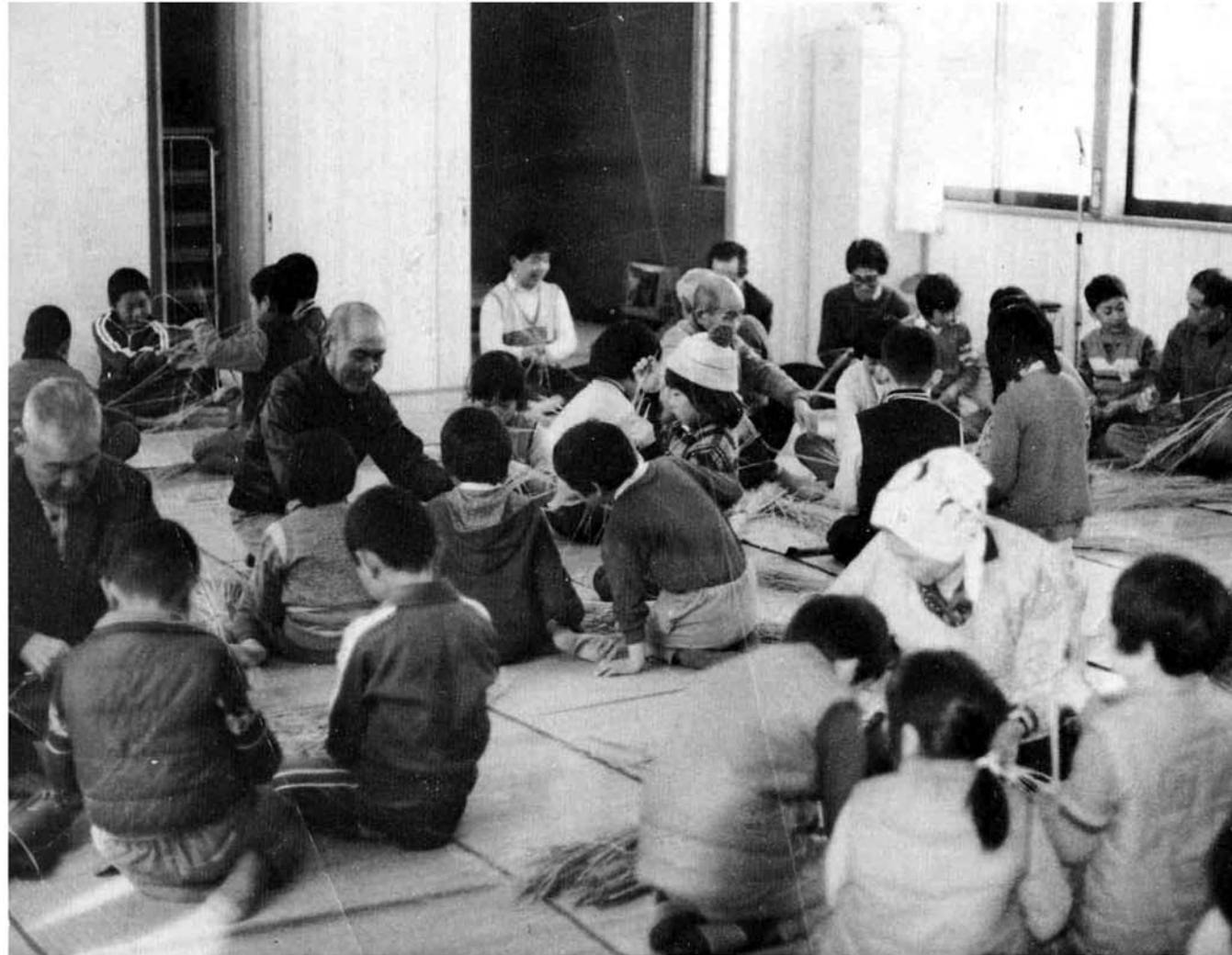
3月12日(土)東谷集落開発センターにおいて地元老人クラブの会員によるチビッコたちに縄ない実習「強い縄が出来るかな。」

■ 発行 / 越路町役場 (新潟県三島郡越路町) TEL (02589) 2-3111 ■ 印刷 / 大川印刷株式会社