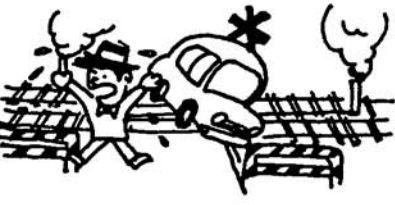
踏切内の事故は まず列車を止める

二、冬のエンストによる事故が多くなっています。踏切通行の際は、ローギヤーで一気に通過しましょう。踏切上でのギヤチェンジをしないでください。