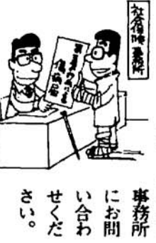
事務所に問い合わせください

このため、交通事故など第三者の行為により生じた負傷で健康保険を使った場合は「第三者の行為による傷病届」を社会保険事務所に届け出すことになっています。