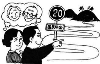
はたちのみなさん 老後をたのしく

国民年金に加入すると、老後の所得保障としての老齢年金はもちろんのこと、永い人生の途中における不慮の出来事にもいろいろな年金が支給されます。