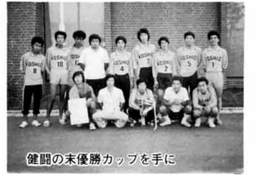
健闘の末優勝カップを手に

去る八月十九日、二十日の二日間、上越市において第二十六回新潟県青年大会が行なわれました。この大会は、県下の勤労青年を対象に、スポーツや芸能、意見発表などを通じて友好を深めることを目的として、県下各地から約千六百人の参加がありました。当町から、郡大会、中越大会と勝ち進んだバレーボール男子チームが参加しました。試合は、二十五度を超す暑い体育館の中で進められましたが、選手たちは、日頃のほげしい練習で鍛えたこともあり、最後まで、バ