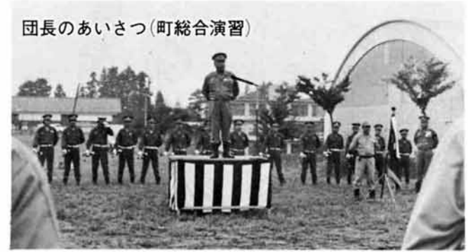
団長のあいさつ(町総合演習)