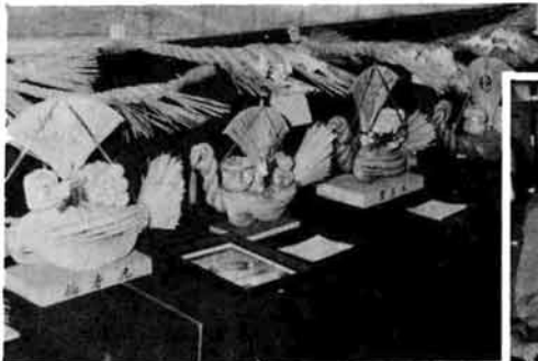
▲毎月行なわれている高齢者教室 で一足早く、縄、宝船のワラ細工 講習会が催れ、町文化展に苦心の 作品が陳列されました。

現在、大手高校二年生、将 来の就職を心配するお母さん に、まだまだいろいろな事をや りたいと意気こんでいる。