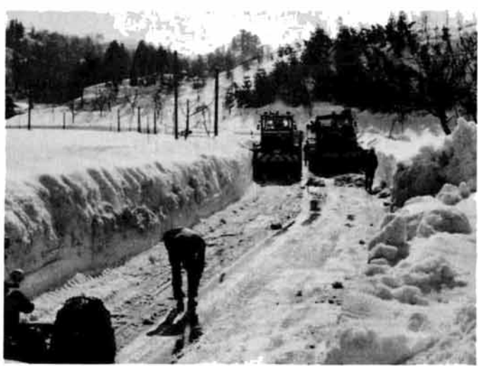
写真は今年2月の除雪作業