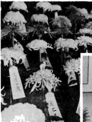
▼11月3日文化の日には、福祉 センターにおいて文化展が開か れ絵画、書道、写真、手芸、細 工品、菊花などが出品されまし た。