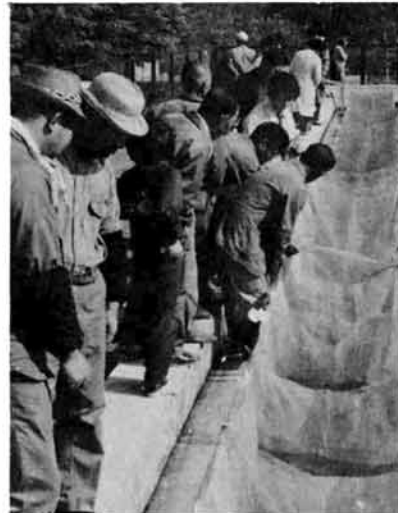
▲10月19日、岩塚小学校で錦鯉 品評会が行なわれ、水の中をゆう ゆうと泳ぐ錦鯉の美しさは、 観覧者を楽しませてくれました。