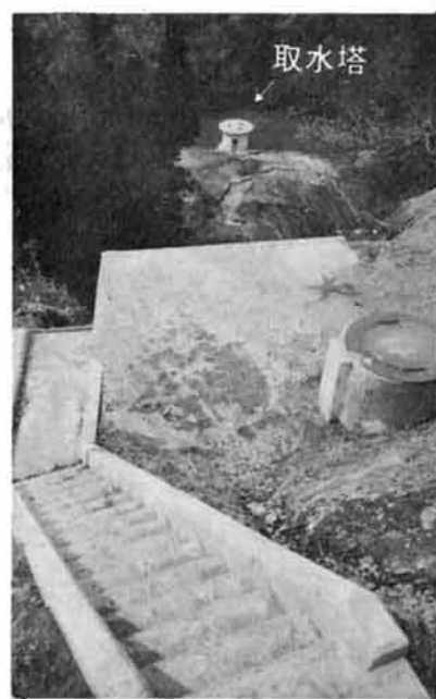
取水塔 ▷一四六段の階段がついた

水源地である小国町の最南端大貝地区の高台に洪海川の表流水を揚水し飲用水に浄化する浄水場が昨年完成、一部給水すべく努力しましたが、資材の不足と異常な豪雪で工事がおくれでしたが、雪消えと同時に工事も順調に進んでいます。