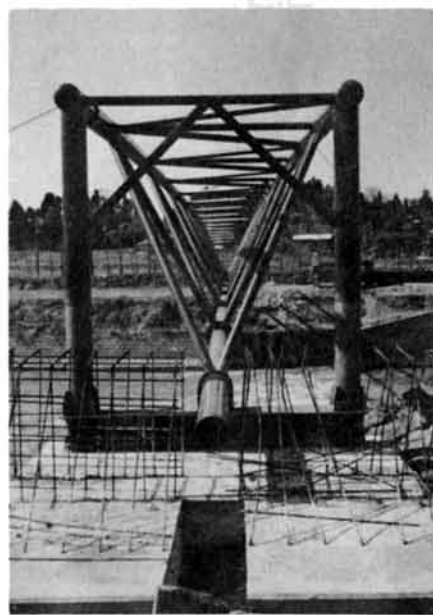
△雪積地にめずらしい水管橋

一万四千人の飲用水を作る浄水場は洪海川より六十四メートルの高台で、浄水場から取水塔までは絶壁にほど近く百四十六段の階段が作られており直径二・七メートルの円すいの取水塔が小さく見えす。 この広域筒水で特に目につくものは、小国町、越路町向町とも洪海川流域に部落が形成され町の中央を洪海川が貫流するいわば、水にはぐくまれ発展してきた町で、五十メートル以上の水道専門の大きな橋(水管橋)が九つもかけられます。この橋は逆三角形の珍しい形の水管橋です。小国と越路を結ぶ水管橋が五月下旬架橋され(サキノ島橋下流)待ちこがれていた越路地区の水道管布設がいよいよ始まります。