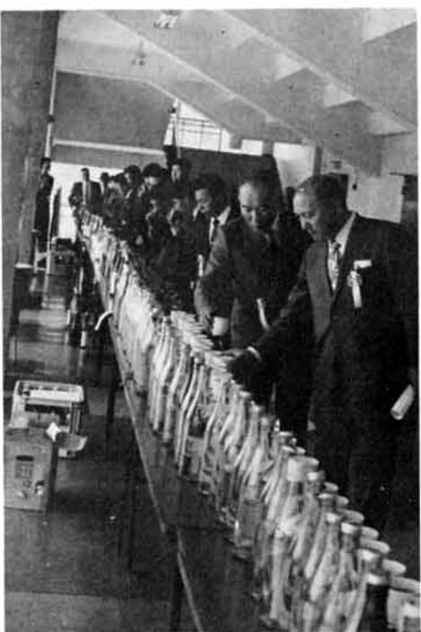
きき酒をする一般者

七回目を迎えた新潟県清酒品評会は、五月二日長岡市厚生会館で行われました。全国各地の酒造場で、県内の杜氏が冬期間腕によりをかけて造りあげた清酒二百五十点をもちより、県醸造試験場長が審査長とな