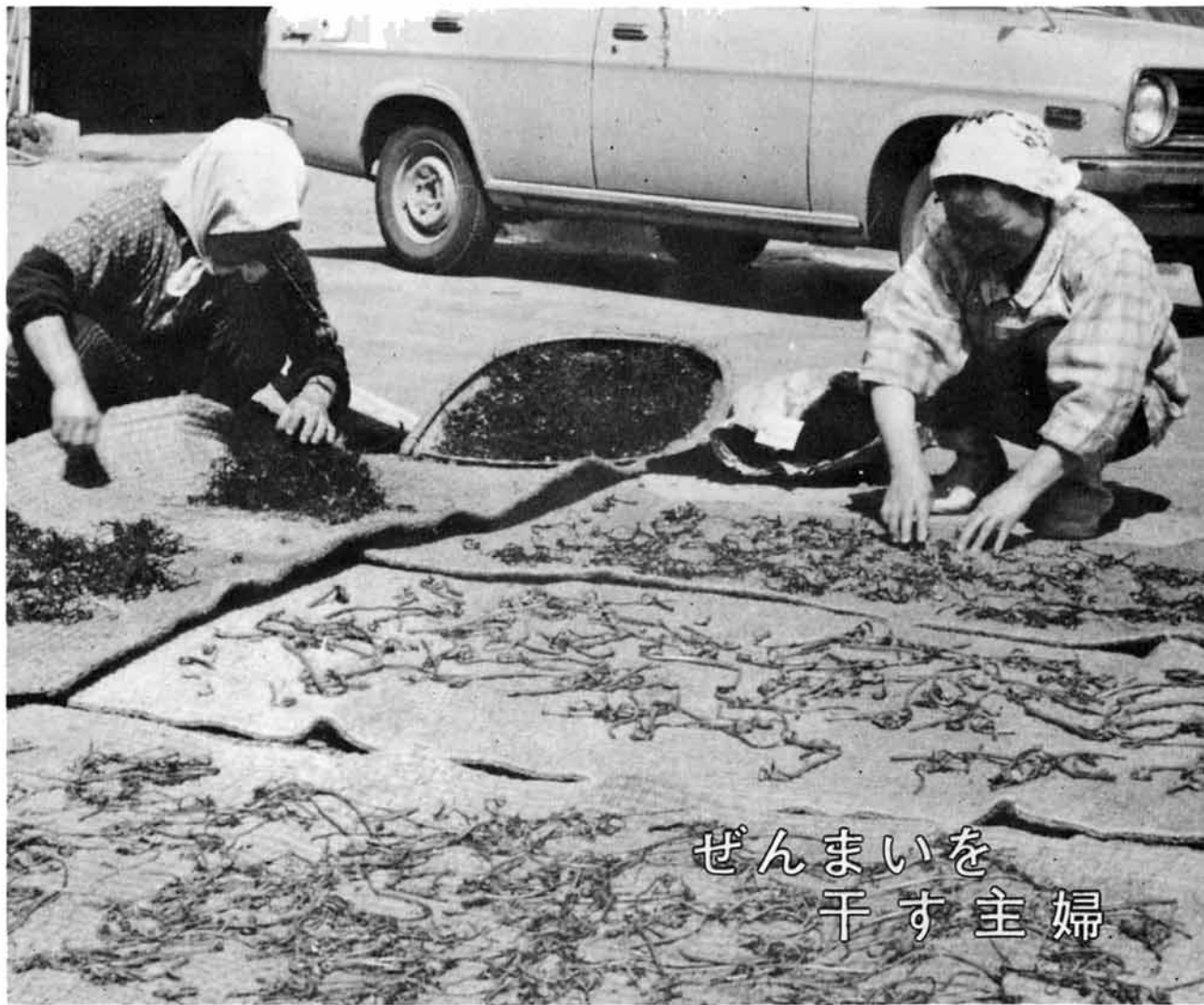
ぜんまいを干す主婦

発行/越路町役場 (新潟県三島郡越路町) TEL (02589) 2-3111 印刷/大川印刷所