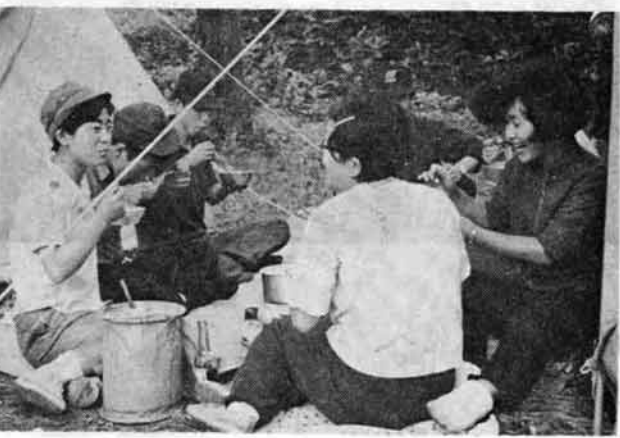
↑ 「味はどうですか」「ウーンたべられるね！」夏は若い人でにぎわいます。 杓形山ハイキングコース、飯塚と岩田に登り口があります。

最近の私達の生活の中には、労働時間の短縮や、電化による家事労働の合理化などにより、自由時間がふえ、余暇を過ごす時間が新しく入ってきております。 そんな背景の中で、手軽に家族づれで楽しめる観光地を当町にもと、杓形山の開発が進められることになりました。 この山は、子供達の遠足や家族づれの山菜採り、またキャンプにと、訪れる人々も年々多くなっています。 そうした利用者たちから、特に要望の強い便所と水呑場を設置することになりました。便所は駐車場の端にブロック建で設置され、水呑場は、殿様清水に通ずる道路を駐車場からまっすぐに、しかも上り下りが楽に出来るよう