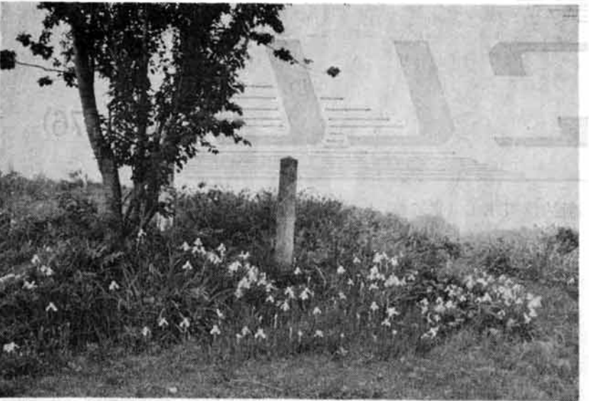
杓形山の山頂、初夏には戦国の昔をしのぶかのようにあやめがたくさん咲きます。ここに立つと、日本海、上越の山々、越後平野が一望にみわたせます。

最近の私達の生活の中には、労働時間の短縮や、電化による家事労働の合理化などにより、自由時間がふえ、余暇を過ごす時間が新しく入ってきております。 そんな背景の中で、手軽に家族づれで楽しめる観光地を当町にもと、杓形山の開発が進められることになりました。 この山は、子供達の遠足や家族づれの山菜採り、またキャンプにと、訪れる人々も年々多くなっています。 そうした利用者たちから、特に要望の強い便所と水呑場を設置することになりました。便所は駐車場の端にブロック建で設置され、水呑場は、殿様清水に通ずる道路を駐車場からまっすぐに、しかも上り下りが楽に出来るよう