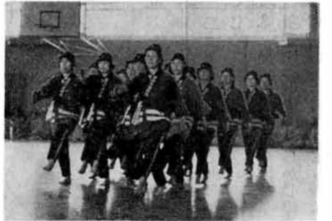
婦人消防隊の訓練

また、町の消防に、広域化（？）してゆくいろいろな火災に対処してゆくため、新たに化学消火機が装備されましたが、その実験を兼ねて油火の消火訓練が行われました。 指揮者の号令で、キビキビと行動する訓練ぶりは、参観者の目に頼もしく写ったことでしょう。