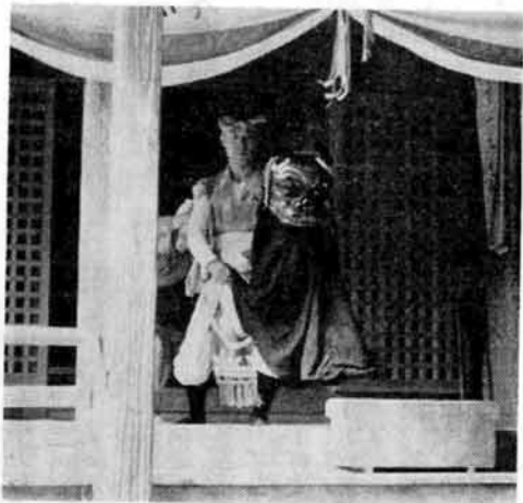
菅沼神楽のほかに今残されているのに飯塚神楽があり、以前には不動沢にもあったとか、とにかく無形文化財としての滅びゆく民俗芸能を少しでも残したいものである。

菅沼部落の十二大明神は天和三年（一六八六）の検地において、三石余の餘地があったといわれており、この大明神に伝わる神楽舞もまた、徳川初期から伝えられて来たといわれているが詳細は不明である。 伝来については刈羽方面からと考えられると県文化財調査審議委員桑山太市先生は説明されている。 所演は、毎年四月十二日の春祭りにお宮の拜殿で舞っていたが、近年は八月七日の風