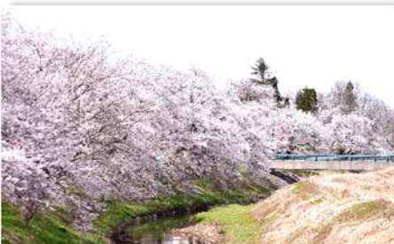
焼田川・岩野橋(岩野地内)