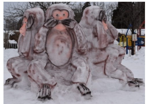
見ざる聞かざる言わざる