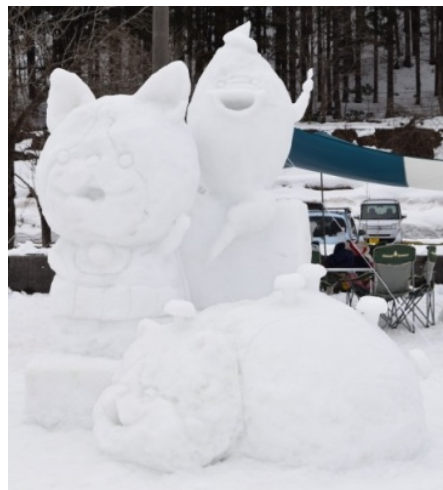
ジバニャンだニャ〜!