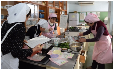
食推さんによる塩分測定

食生活改善推進委員主催の“おいしい減塩料理教室”が福祉センターで行われました。家庭のみそ汁を持参し、塩分測定で家庭の塩分濃度を知ってもらいました。今回の調査では、平均0.78%で薄味でした。その後、食推さんの指導のもと、だしや酢を使った、野菜たっぷりの減塩料理を作りました。薄味でもおいしいと、とても好評でした。みそ汁の塩分測定は、地区の食推さんや支所でも行っています。