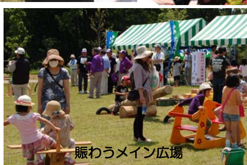
賑わうメイン広場

花いっぱい in 越路が青空のもと開催され、たくさんの方で賑わいました。ご協力、ご参加いただいた皆様ありがとうございました。(5月27日防災ひろば・越路体育館駐車場)