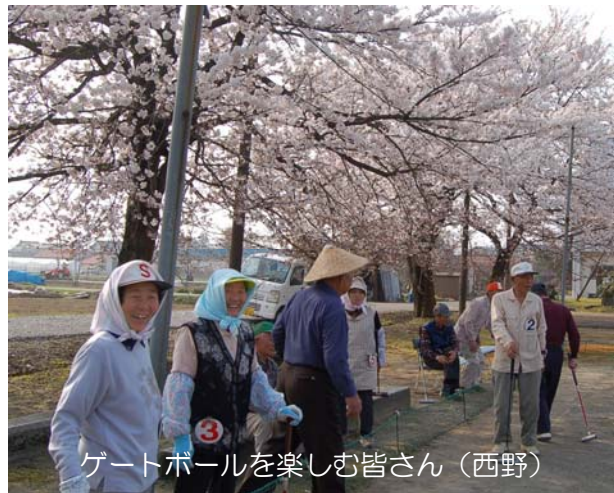
ゲートボールを楽しむ皆さん(西野)

「ばあかきれいだから、写真を載せてくれて」と、地区の桜を誇らしげに説明してくれます。越路地域には本当にたくさん桜があつて、どれも「見事」としか言いようがないほど素晴らしい桜ばかりでした。各地区、自慢の桜をご覧ください。