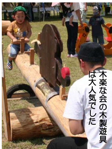
木楽な会の木製遊具は大人気でした