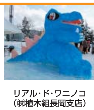
リアル・ド・ワニノコ (株植木組長岡支店)