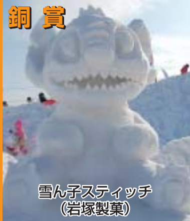
雪ん子スティッチ (岩塚製菓)