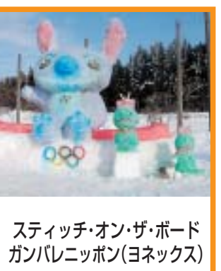
スティッチ・オン・ザ・ボード ガンバレニッポン(ヨネックス)