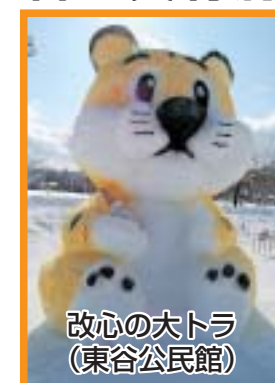
改心の大トラ (東谷公民館)