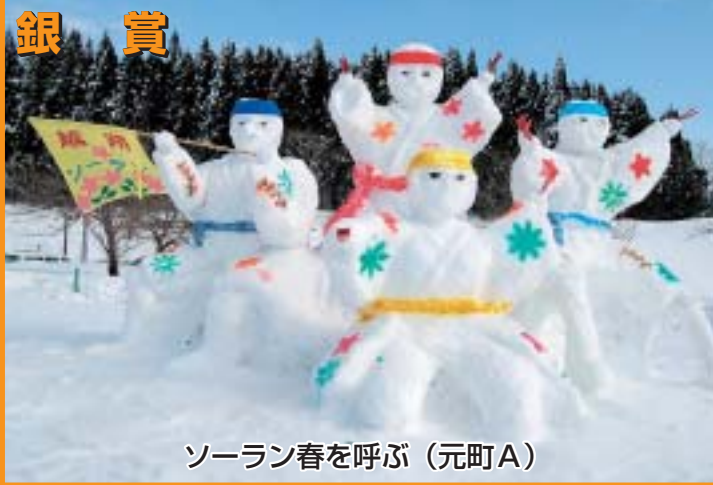
ソーラン春を呼ぶ (元町A)