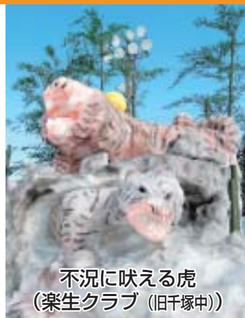
不況に伏える虎 (楽生クラブ (旧千塚中))