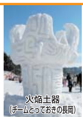
火焰土器 (チームとっておきの長岡)