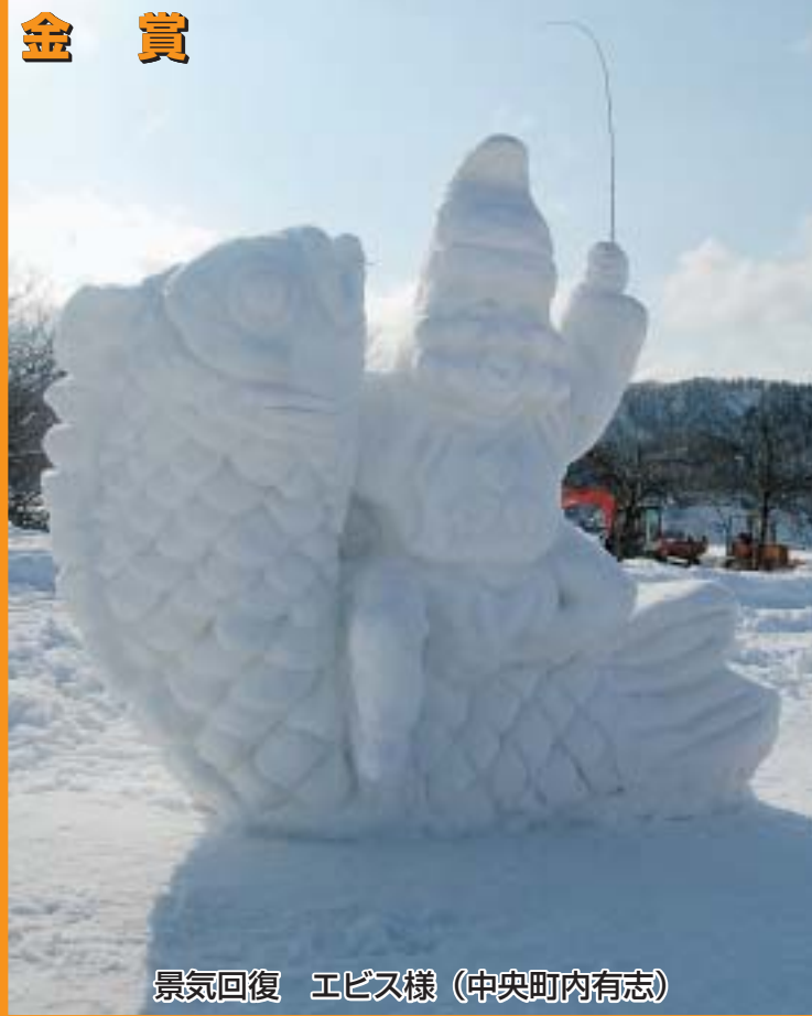
景気回復 エピス様 (中央町内有志)