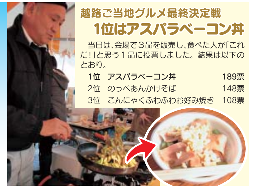
アスパラベーコン丼