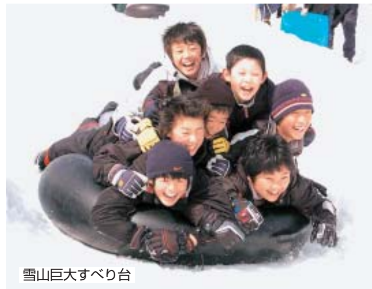
雪山巨大すべり台