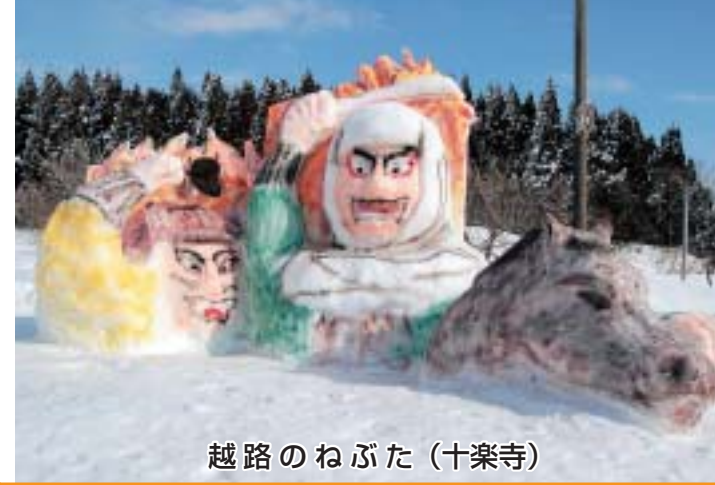
越路のねぶた (十楽寺)