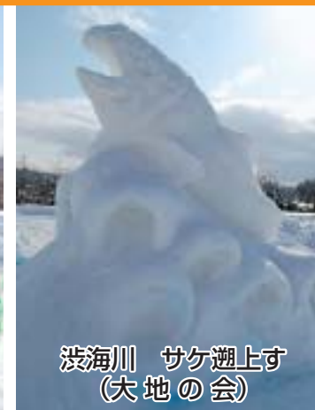
浜海川 サケ遡上す (大地の会)