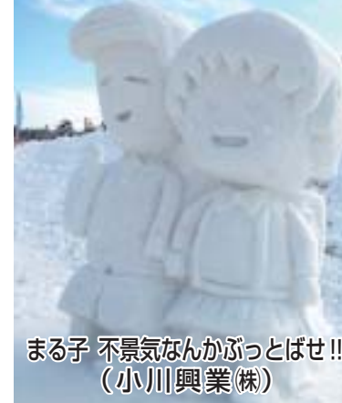
まる子 不景気なんかぶっとばせ!! (小川興業(株))