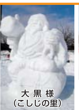
大黒様 (こしじの里)