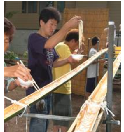
10メートルを超えるそうめん流し。 次々と流れてくるそうめんに箸が進みます。