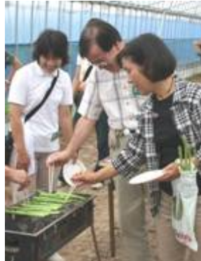
↑アスパラの炭火焼は 甘みがあっておいしい!