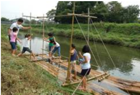
竹のいかだづくりでは、先端を曲げるのに苦労したそうです。 子どもたちは順番に乗り、揺れるたびに大きな歓声をあげていました。

神谷地区の皆さんは、暑さを乗り切ろうと地区内で切り出された竹を使い、そうめん流しといかだを作りました。参加した人たちはいかだで川下りをしたり、流れてくるそうめんに舌つづみをうち、暑さを忘れて楽しんでいました。