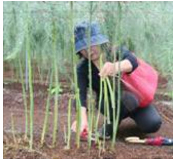
↑ていねいに収穫して お土産にしました。

アスパラ収穫体験・試食 → 岡村権左衛門碑見学 → 井上円了碑見学 → 慈 光寺参詣 → 宝徳稲荷大 社見学→もみじ園(抹茶)