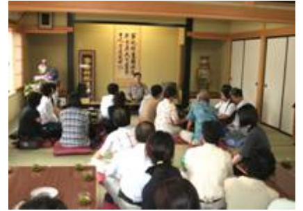
↑妖怪博士として知られる井上円 了の生家、慈光寺にて。歴史を感 じたひととき。