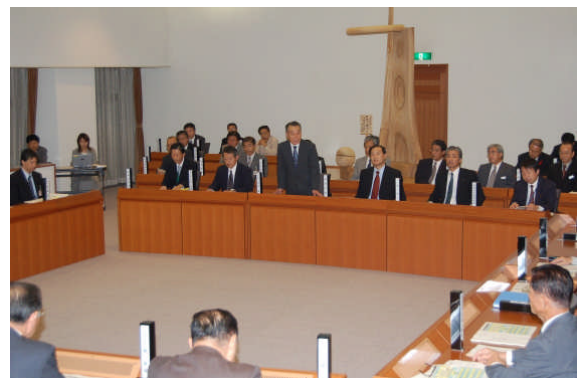
前回の地域委員会の様子。総合計画について検討しました。