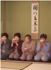
↑もみじ園にて 抹茶を一服

越路の魅力を一日で体験してしまおうというこの企画に30人が参加しました。当日の様子をお伝えします。