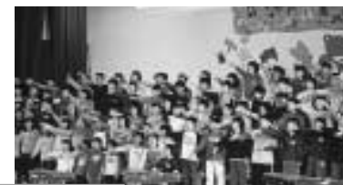
心を込めて歌う子供たち

昭和四十六年 一月に、四季 折々の子供たち の生活を込めた 四つの校歌、それに式 典歌を合わせて五つの 校歌が制定されました。 子供たちは、この五つ の校歌に愛着を感じる と共に、心を込めて精 一杯歌うことを誇りに 思っています。