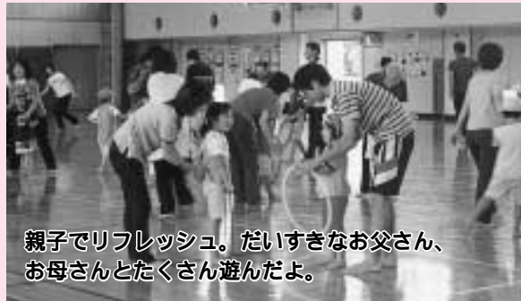
親子でリフレッシュ。だいすきなお父さん、 お母さんとたくさん遊んだよ。