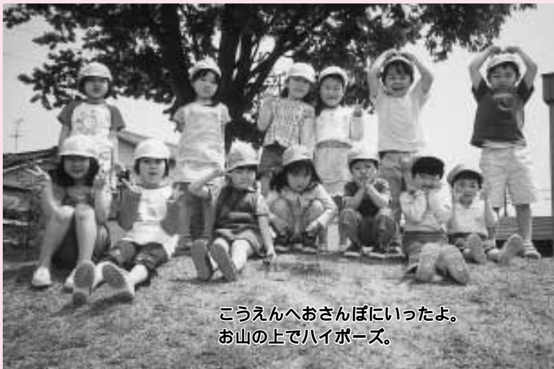
こうえんへおさんぽにいったよ。 お山の上でハイポーズ。