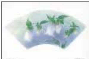
ホタルブクロ 越路町の花