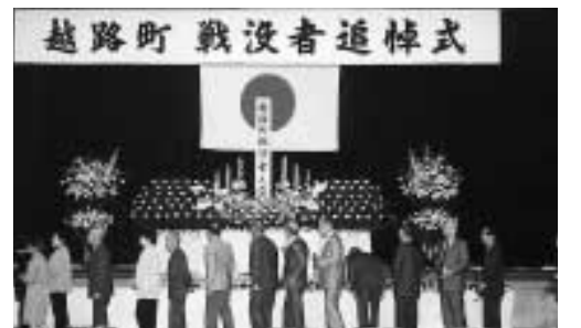
参列者一人一人が献花を行いました

町長の式辞のあと黙祷を捧げ、続いて県知事代理をはじめ来賓各位より哀悼のことばが述べられました。最後に、参列された遺族全員が菊の花を捧げおごそかに戦没者の冥福を祈りました。