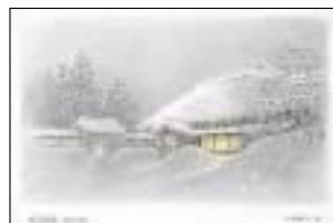
長谷川邸 重要文化財