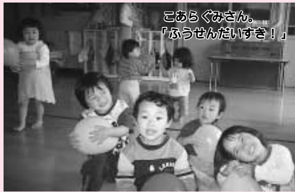
こあらぐみさん。 「ふうせんだいすき！」