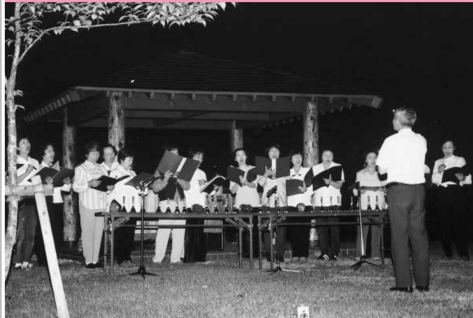
公園内の池のほとりで行われたミニ音楽会