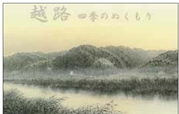
表紙 ふるさとの晩鐘 浪海川と樹形山(城跡)遠望

原画展 期間 平成15年7月7日(月)~8月17日(日) 午前9時~午後4時30分 場所 昔ばなしとほたるの館