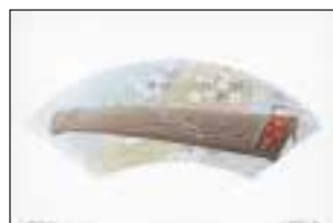
和のしらべ 琴の出来る町

原画展 期間 平成15年7月7日(月)~8月17日(日) 午前9時~午後4時30分 場所 昔ばなしとほたるの館