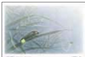
ほたる舞う 雪ぼたるとの里(環境庁認定)