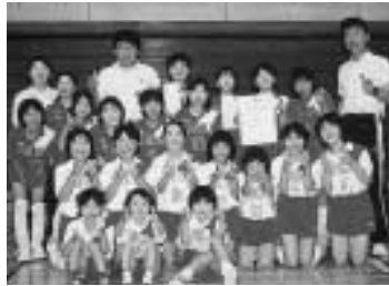
県大会の出場を決めてハイゲッチュー! ガンバレ! 越路JVC

女子は県の新人戦で4強入りし、シード権を獲得、好位置からのスタート。男子は県の強豪チームと練習試合を重ね、着々と力をつけており、県大会での活躍が期待されます。