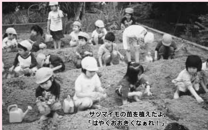
サツマイモの苗を植えたよ。 「はやくおおきなあれ！」