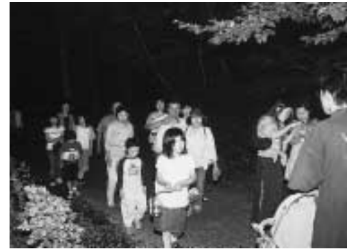
初夏のひととき、ほたる観賞に多くの皆さんが訪れました

ステージイベントが終わる頃、ようやくあたりは暗くなり、ペットボトルちょうちんの灯りをたよりに公園内に入ると、たくさんのホテルが飛び交う様子を見ることができました。また、公園内の池のほとりで行われたハンドベルの演奏とコーラスグループによる歌声が、訪れる人をやさしく迎えてくれました。清流に住むといわれるホテルの美しく幻想的な光の乱舞をいつまでも見られるように、ホテルの住みよい環境を残していきたいものです。