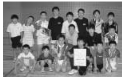
県3位入賞! 中野島JBC男子チーム

その中で、優勝した新潟Jr.に2-3で惜しくも敗れましたが、小須戸Jr.との大接戦の末3位に入賞することができました。練習を週1回から週3回の希望参加制にしたこと、塚山JBCとの合同練習など普段の練習成果が徐々に現れてきたようです。更なる練習を重ねて県大会以上の成績を目指して頑張っていきます。