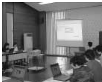
プロジェクターを使っている教室

貸出し品 ・液晶プロジェクター ・単焦点ズームレンズ ・スクリーン ・ノートパソコン ・ショッピングケース