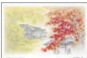
もみじ(もみじ園) 越路町の木