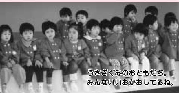
うさぎぐみのおともだち。 みんないいおかおしてるね。