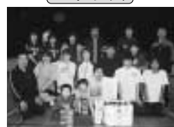
浦中ファミリーズA