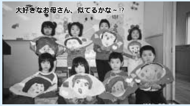
大好きなお母さん、似てるかな~!?