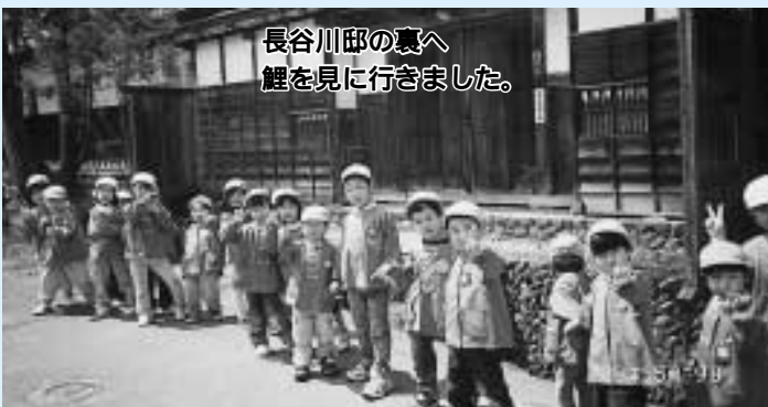
長谷川邸の裏へ 鯉を見に行きました。