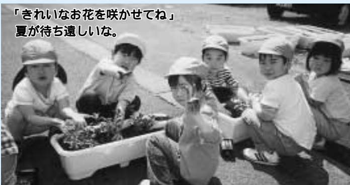
「きれいなお花を咲かせてね」 夏が待ち遠しいな。