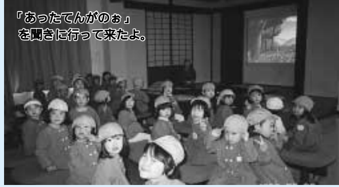
「あったてんがのお」 を聞きに行ってきたよ。