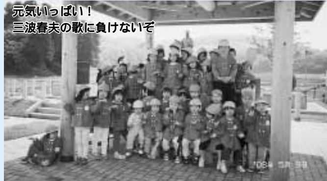
元気いっぱい! 三波春夫の歌に負けないぞ