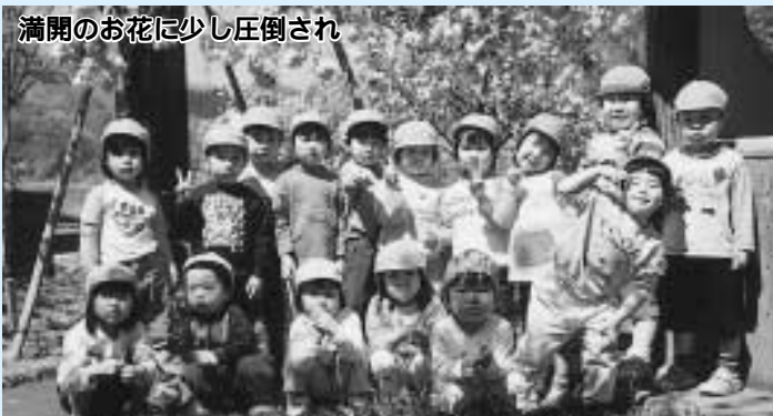
満開のお花に少し圧倒され