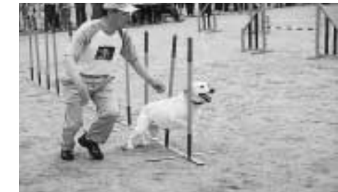
人と犬による息のあった演技 アジリティ

さわやかな青空の下、飼い犬と飼い主が力を合わせ競い合うスーパードッグスコンペティションが、5月10、11日の2日間、河川公園で開催されました。スーパードッグスコンペティションでは、人が投げたfrisbeeを犬がジャンプして取るディスクドッグや飼い主の指示により犬が障害物を越えていくアジリティなど4種目の競技が行われ、全国を転戦している約120チームが参加、人と犬が一体となった妙技を披露してくれました。また、会場に設けられたふれあいコーナーでは、犬と遊ぶ子どもたちの笑顔が印象的でした。