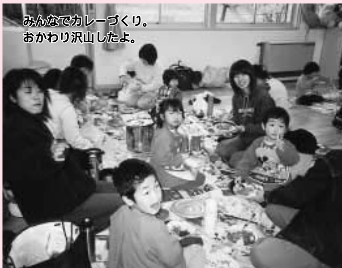
みんなでカレーづくり。 おかわり沢山したよ。