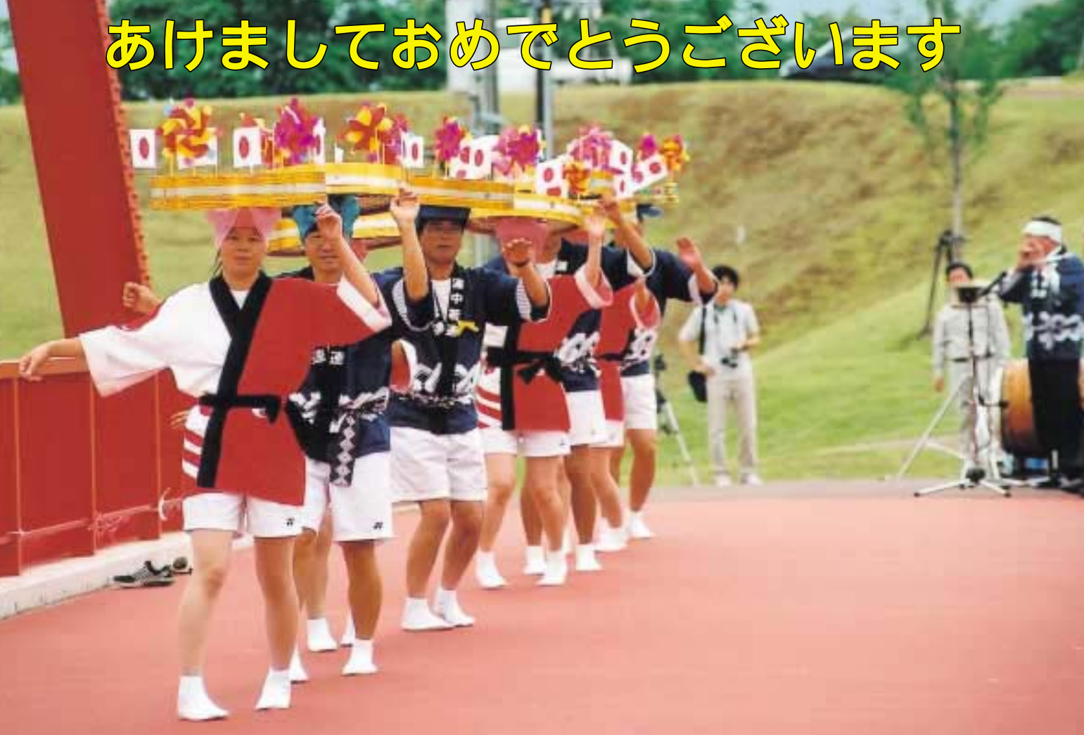
浦中地区のみなさんによる手踊り(あめやさん)