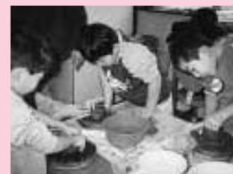
う〜ん、なかなか難しいな〜

わんぱく陶芸教室は今回で3回目を迎え、以前に参加した子どもたちも多く、しだいに陶芸の腕も上がってきました。みんな、それぞれ思い思いのオリジナリティあふれる作品をたくさん作り、その発想に驚かされる作品が数多くありました。