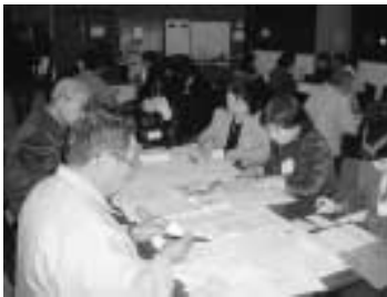
グループに分かれ、ごみを減らすにはどうしたらいいか話し合いが行われました。

10月より全4回の日程で開催された「越路町ごみ推進地区」リーダ養成講座が12月4日をもって終了しました。講座では、「生ごみをたい肥にかえるボカシ作り講座」や「ごみはどうやって処理されているかを知るために、ごみ処理場見学会」などが行われ、参加者は、ごみ減量の必要性を感じ家庭から出されるごみを減らすにはどうしたらいいか熱心に話し合いました。 なぜ、ごみを減らさなければいけないの？ 現在、越路町の各家庭からごみステーションに出されたごみは、次のように区分され各処分場に運ばれて処理されています。 「燃えるごみ」「燃えないごみ」「粗大ごみ」「三島町鳥越事業所」 「袋一括収集」「缶・ビン・ペットボトル」…長岡市事業所 このうちの「燃えるごみ」「燃えないごみ」「粗大ごみ」を処分している三島町鳥越事業所の最終処分場が、今後8年位でいっぱいになってしまえば、 みんなで取り組もう！ごみ減量活動！ 用でなくなってしまう。これはごみ処理場を借りている立場の町にとっては大変深刻な問題です。そこで、少しでも長くごみ処理場が使用できるようにということで本講座が開催されました。 ごみ問題は、ダイオキシンや地球温暖化問題と共に世界規模で取組まなければいけない問題になってきました。一人一人が、少しでもごみについて考えるきっかけとなるよう、今後もこの講座を開催する予定です。