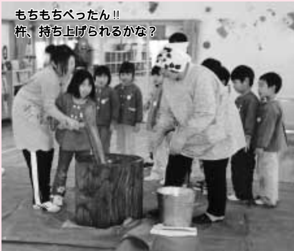
もちもちぺったん!! 杵、持ち上げられるかな?