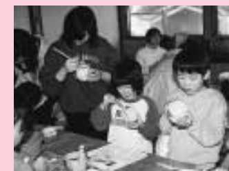
僕と、私と、お母さんと色付け