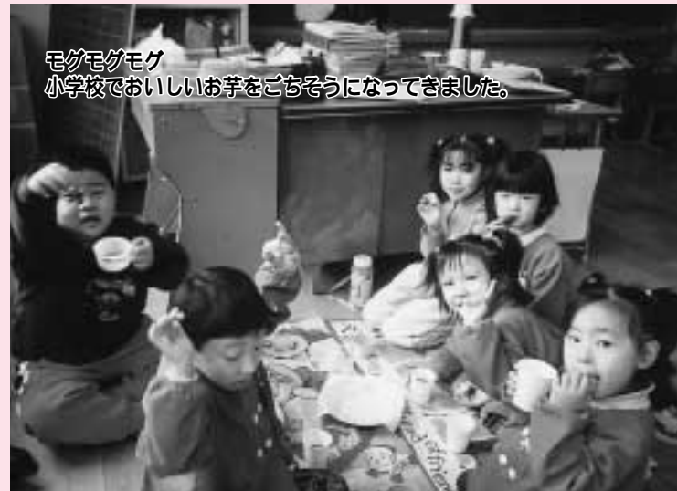
モグモグモグ 小学校でおいしいお芋をごちそうになってきました。