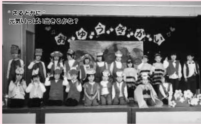
“さるとかに” 元気いっぱい曲るかな?