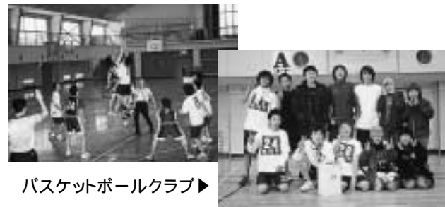
バスケットボールクラブ▶

「越州」と「バスケットボールクラブ」の間で決勝が行われ、「バスケットボールクラブ」が若さ溢れるプレーで勝利し優勝を飾りました。