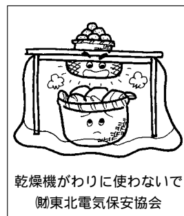
乾燥機がわりに使わないで(勸東北電気保安協会)

対象者 世帯の年間収入が990万円以内の保護者の方(事業所得者は770万円) 融資限度額 200万円 金利 年1.6%(平成14年11月11日現在) 融資期間 10年以内 返済方法 毎月元利金等払 問合せ 国民生活金融公庫長岡支店 ☎36-4360