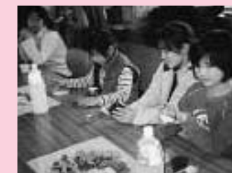
自分の作品の完成に満足!!