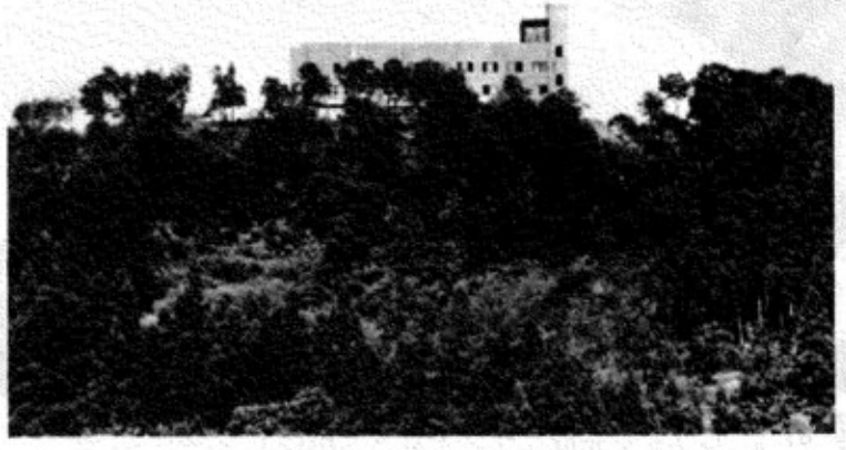
▲ 西川口から建設労働者研修福祉センターを望む