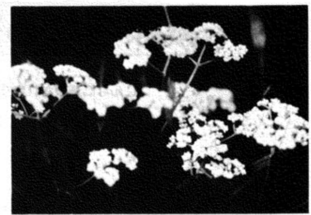
「手にとれば、袖さえにおうをみなえし、白露に散らまく惜しも」

この歌は、手に折りとってみると着物の袖までも色が染ってしまふような美しいオミナエシがこの白露のために花を散らしてしまうのが惜しいという愛惜の気持ちを表わしたものであり、秋の七草のひとつとして古くから知られている。万葉集にはオミナエシをよんだ歌が十種以上もある。 このオミナエシは秋の野につつましそうでやさしく日本人好みの趣を漂よわせている。オトコエシはオミナエシに対する名前であり、日本全土でみられトチナとかシロアワバナなどの方言もある。中国では敗醬(バイチャン)とよぶ。薬用植物としても「神農本草」(五〇〇年)にもでており、消炎・排膿・できものなどに用いられた。江戸時代には、オミナエシとオトコエシの二種を別にしなくて敗醬の白花・黄花としていた。道路の崖によく見られる草で独特の強い臭いを発する。