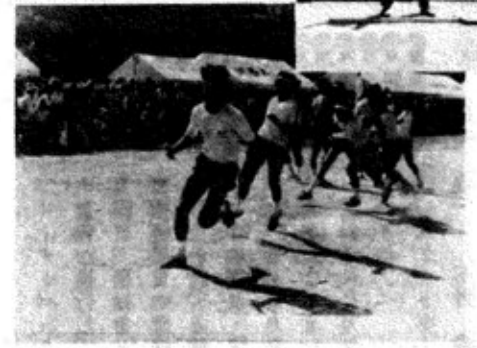
▲地区館対抗リレー