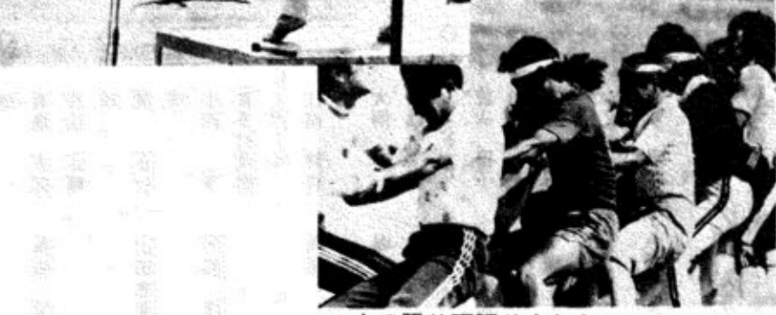
▲力の限り頑張りました