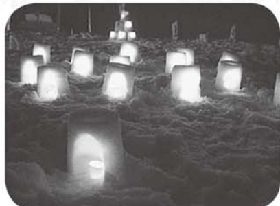
幻想的な灯りが灯されたかまくら