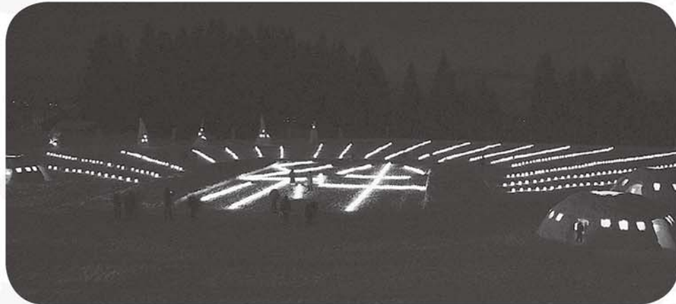
来場者の皆さんと協力して灯した「絆」