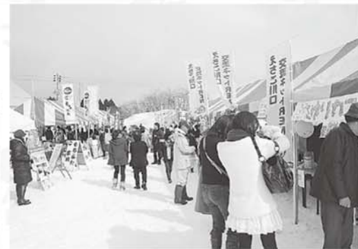
大変な賑わいをみせた うまいもの屋台