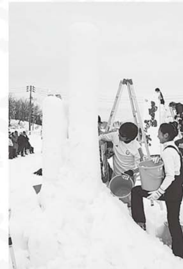
狛江市の皆さんも悪戦苦闘 しながらもがんばりました