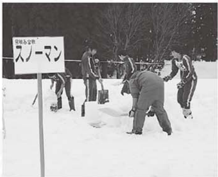
受験を控えた中学生も がんばりました