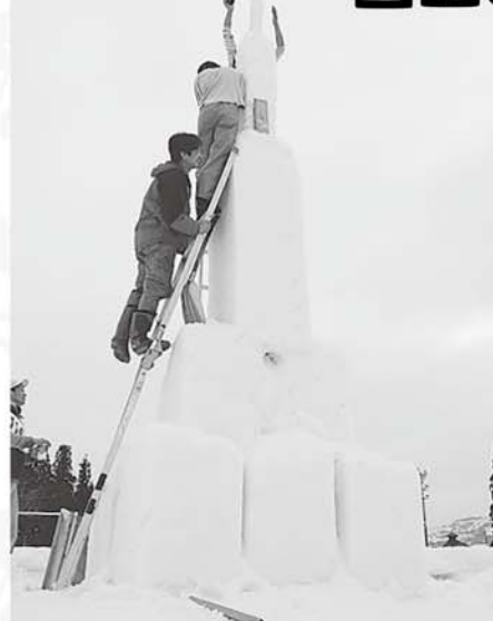
第2回 雪積み合戦、優勝チームは 5m55cm積み上げた（新記録）