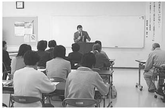
→講演中の様子 参加者の皆さんも真剣な表情で聞いていました。