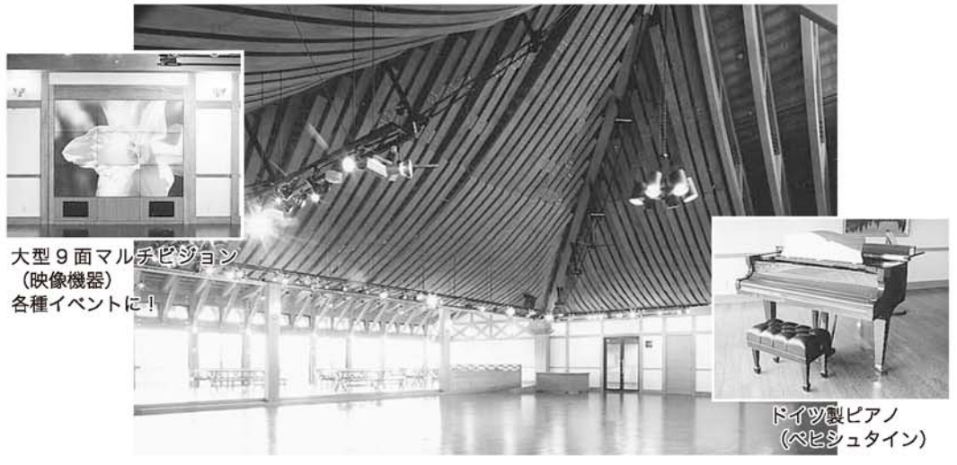
大型9面マルチビジョン(映像機器)各種イベントに!