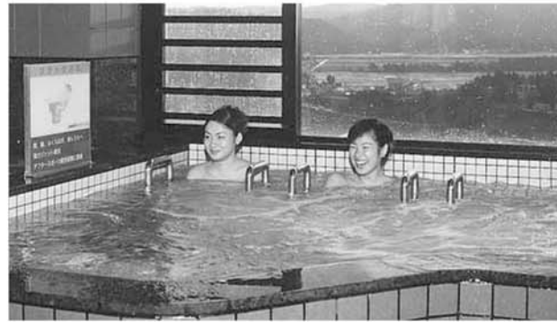
のんびり ゆったり「キャンパス川口温泉」