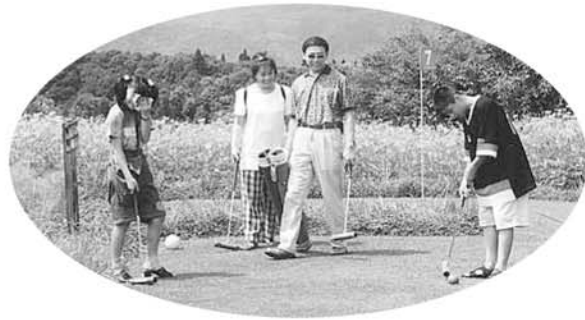
家族で楽しもう！「パークゴルフ」