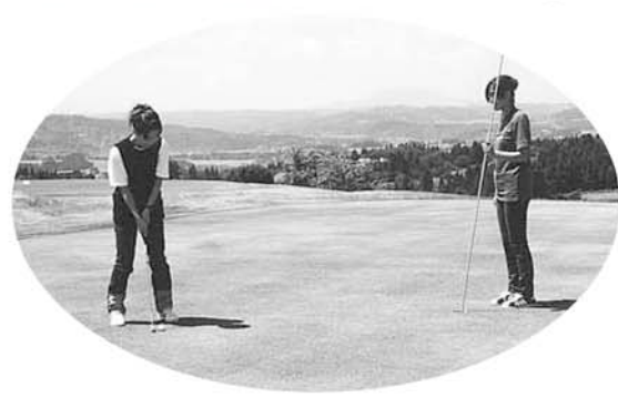
ジュニア料金も新設「川口ゴルフ場」

て、多くの皆さまにご好評を いただいております。 平成12年度から各施設使用 料が改定されましたのでご案