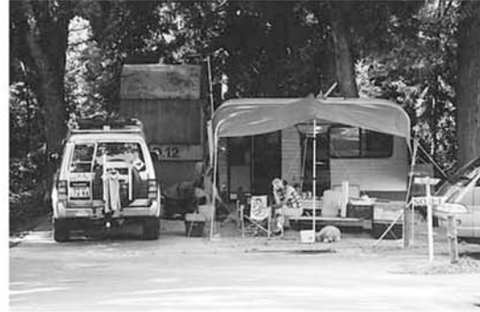
自然とふれあいたいあなたに…「オートキャンプ場」